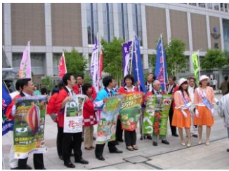
観光プロモーション

十勝観光連盟は、十勝における観光事業の健全な発展と振興を図り、十勝住民の文化生活の向上及び経済の発展に資するとともに、国際親善等に寄与することを目的とする。