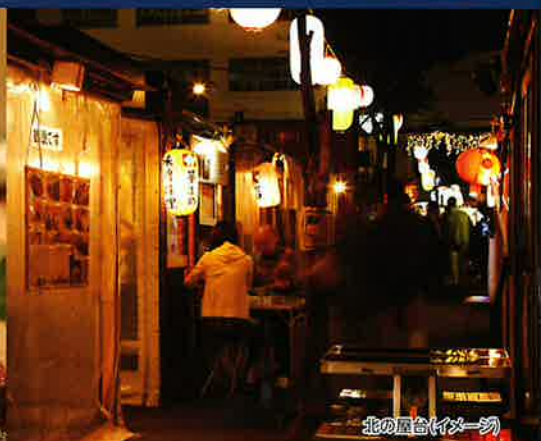
北の屋台(イメーソ)