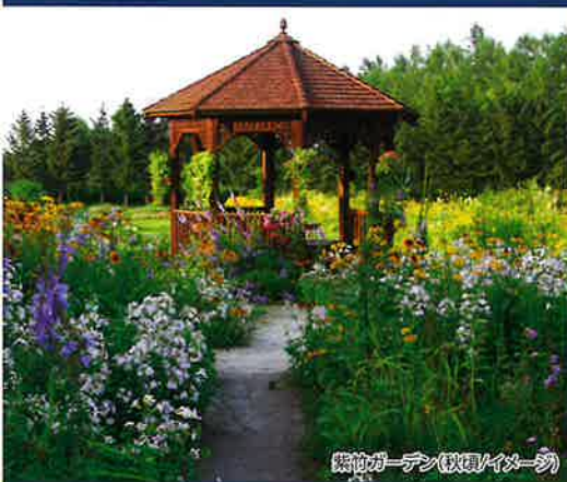
緑のガーデン(秋田/イメーソ)