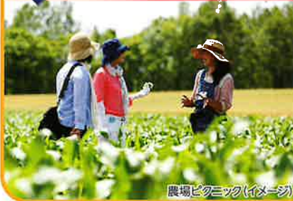
農場ピクニック(イメージ)

畑ガイドが十勝の広大で美しい畑をご案内します。観光農場ではない生産現場の畑を体感できる、楽しく学べるツアーです。収穫時期には畑の中で採れたての作物を召し上がっていただくこともできます。