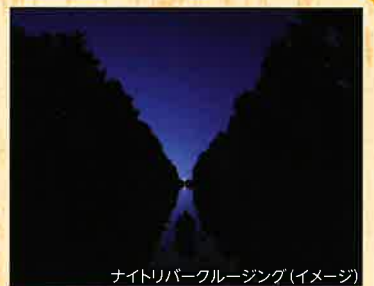
ナイトリバークルージング(イメージ)