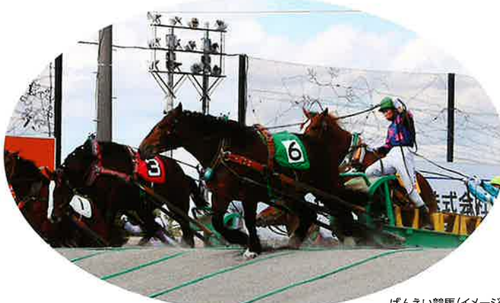
ばんえい競馬(イメージ)