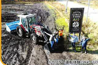
トラクター運転体験(イメージ)

十勝産の旬の野菜を収穫する体験を行っていただけます。それに加えて、農業王国「十勝」ならではの、海外製大型トラクターに乗車します。畑の中を走れば、広大な農地との一体感を感じられます。