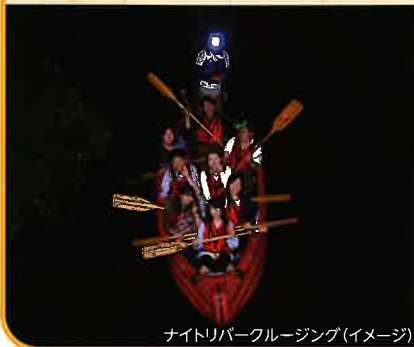
ナイトリバークルージング(イメージ)