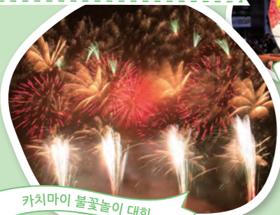
카치마이 불꽃놀이 대회