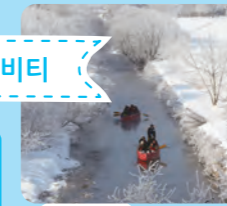
토카치 윈터 리버 크루징