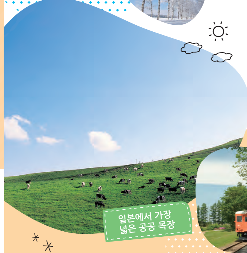
일본에서 가장 넓은 공공 목장