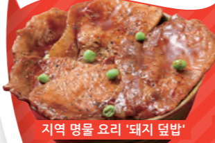
지역 명물 요리 '돼지 덮밥'