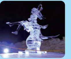
오비히로 얼음 축제