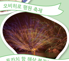
토카치 항 해상 불꽃놀이 대회