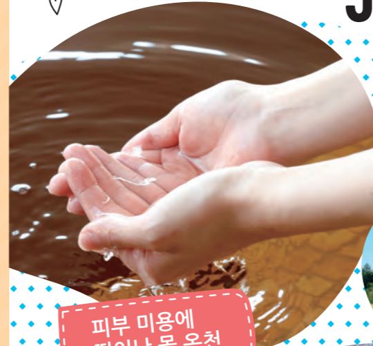
피부 미용에 뛰어난 물 온천