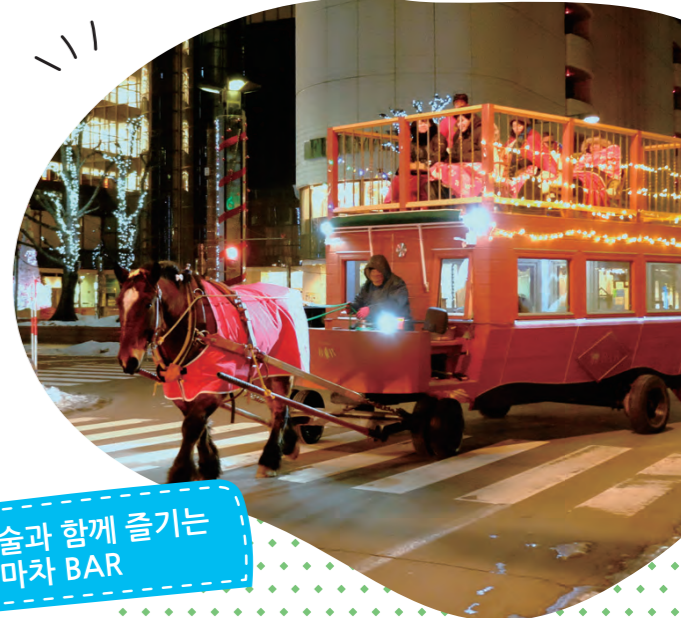
술과 함께 즐기는 마차 BAR