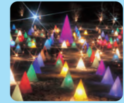
오토후케 토카치가와 백조 축제 '사이린카'